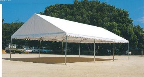
PHOTO: 7.2m x 10.8m

運動会や文化祭など野外催事に大活躍するパワーパイプテント。好評に応え、従来のシリーズにサイズバリエーションを充実、さらに部材がポストシंकを使用、5.4M×7.2Mから7.2M×14.4Mまでの規格サイズを準備、ますます用途が広がりました。組み立てが簡単だから一般の方にも使いやすく、強さ、すっきりしたデザイン、手頃な価格…とメリットも豊富、イベントの性格とスケールに合わせて、テントも選べる時代がやってきました。